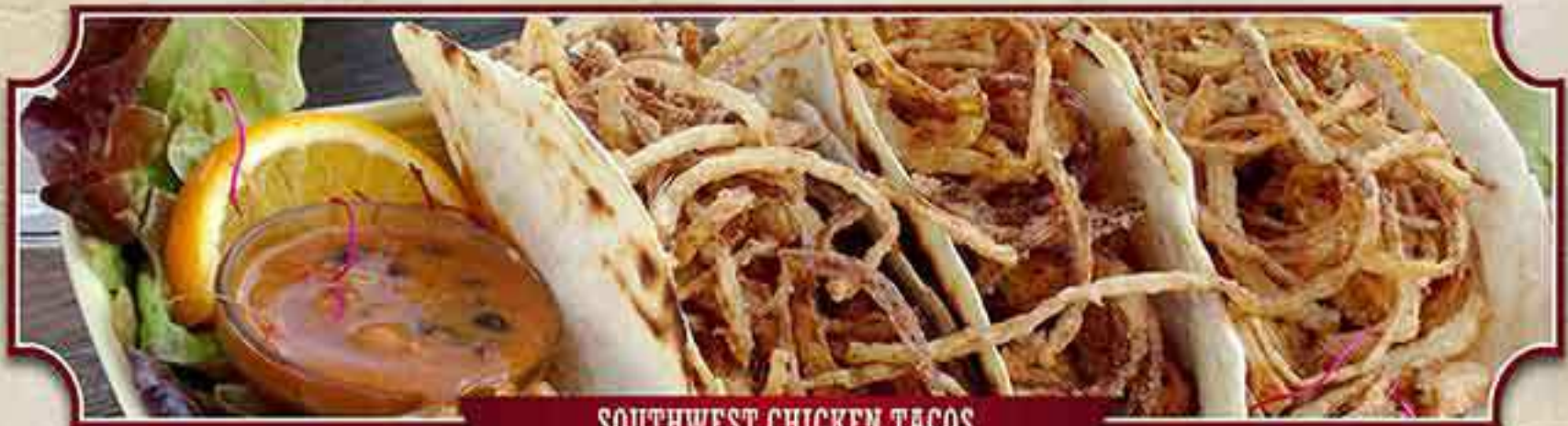
SOUTHWEST CHICKEN TACOS

Gefüllt mit Hähnchenbrust, Avocado, Palmenherzen, Kaktusblättern, Mais, Paprika, Tomaten und Zwiebeln, überbacken mit Käse 1,d , Sour Cream 1,d und Chilisauce e , dazu unser Mexiko-Reis und bunte Bohnen