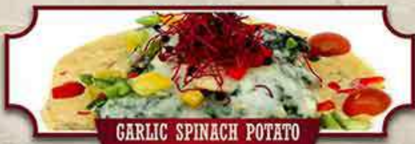
GARLIC SPINACH POTATO

Gefüllt mit gezogenem Putenfleisch, Romana-Salat, Paprika, Zwiebeln, Mais und Käse 1,d , dazu French Fries und BBQ-Sauce