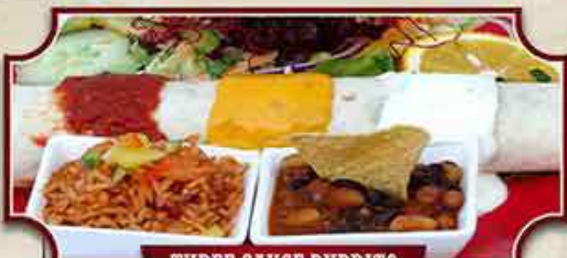
THREE SAUCE BURRITO

Rinderhack-Burrito, Roastbeef-Enchilada und Crispy Taco mit Putenfleisch, dazu unser Mexiko-Reis und bunte Bohnen