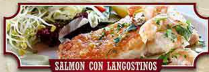
SALMON CON LANGOSTINOS