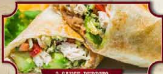
3 SAUCE BURRITO

Rinderhack-Burrito, Roastbeef-Enchilada und Crispy Taco mit Putenfleisch, dazu unser Mexiko-Reis und bunte Bohnen