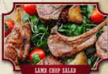
LAMB CHOP SALAD

207 CAESAR SALAD 9.40 Knackig, frischer Romana-Salat mit gehobeltem Parmesan a,d , Walnüssen b , hausgemachten Croutons d und Parmigiano-Caesardressing 3&4