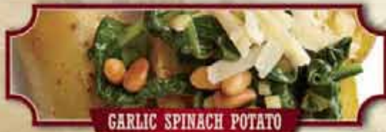
GARLIC SPINACH POTATO