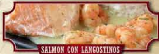
SALMON CON LANGOSTINOS