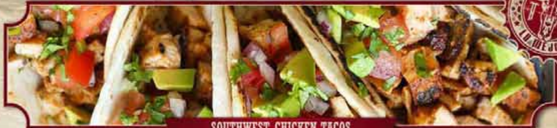
SOUTHWEST CHICKEN TACOS

Gefüllt mit Hähnchenbrust, Avocado, Palmenherzen, Kaktusblättern, Mais, Paprika, Tomaten und Zwiebeln, überbacken mit Käse 1,4 , Sour Cream 1,4 und Chilisauce e , dazu unser Mexiko-Reis und Bunte Bohnen